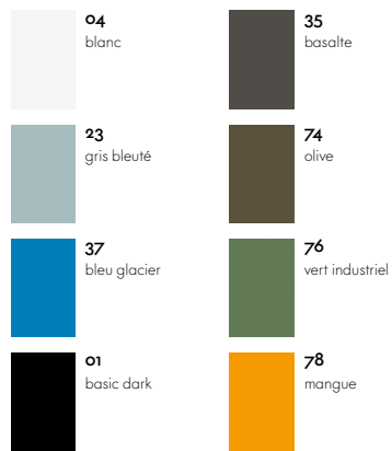
Siège à coque synthétique